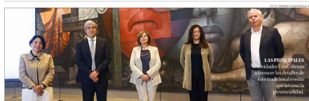
LAS PRESIDENTAS de las Facultades de Educación y de Ciencias Sociales de la Universidad de Concepción.

Bajo la temática "Horizonte de la Humanidad: Sociedad, Sujeto, Persona" el evento cultural y académico tendrá una serie de actividades artísticas y formativas gratuitas para toda la comunidad, destacando la presencialidad en varias de ellas.