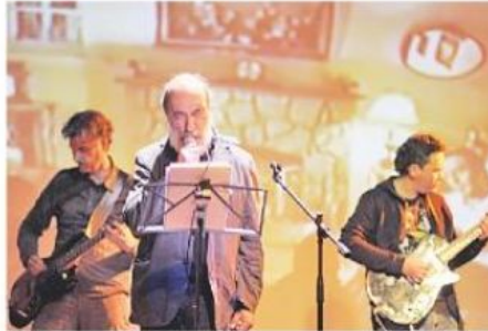
González y los Asistentes junto al escritor nacional Raúl Zurita.

Los organizadores de PM#5, el Colectivo PM, la productora 4Parlantes y sus socios locales: Departamento de Extensión de la Universidad de Concepción, Balmaceda Arte Joven Biobío y Casa de Salud, hacen posible que el Festival Poesía y Música siga trabajando en el intercambio y difusión de poesía y música, imbricadas tam-