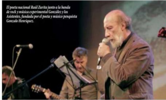
El poeta nacional Raúl Zurita junto a la banda de rock y música experimental González y los Asistentes, fundada por el poeta y músico penquista Gonzalo Henríquez.

Por su parte, el destacado poeta nacional Raúl Zurita junto a la banda de rock y música experimental González y los Asistentes fundada en 1997 en Santiago de Chile por el poeta y músico penquista Gonzalo Henríquez. Desde 2008 la banda comenzó a trabajar en colaboración con el poeta para crear música a partir de sus poemas recitados. De este trabajo conjunto surgió el álbum Desiertos de amor (2011), que se ha presentado en diversos escenarios a nivel nacional e internacional. También fundadora de Festival PM junto a González y los Asistentes, la Orquesta de Poetas llevará por primera