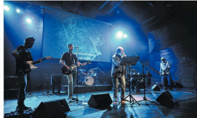
Concepción / Los Diablos. Los Diablos, banda pop de la ciudad de Concepción.

En el marco de la Escuela de Verano UdeC 2022 se realizarán cuatro exposiciones de arte. Estas exposiciones se realizarán en el espacio que se ha reservado para este fin en la Escuela de Verano UdeC 2022.