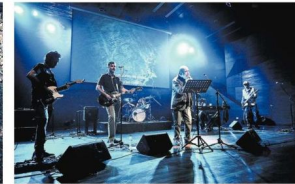
Raúl Zurita estará junto a González y Los Asistentes en una jornada de interacción sonoras fundadas en el rock cruzado con la poesía del arte nacional.

18 horas, todos los días, están agendadas las presentaciones escénicas del festival, con seis tardes por jornada.