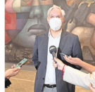
Mag. el conocimiento.

Desde el 17 de mayo, la Universidad de Concepción ofrece un curso de Mag. el conocimiento. Este curso está dirigido a quienes desean obtener un título de Mag. el conocimiento en el área de la salud.