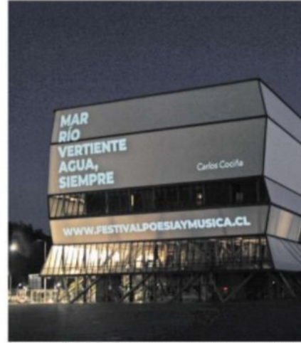
La fachada del Teatro Biobío sirvió para dar el vamos al PM local.

La llegada a Concepción pretende dar espacio a las nuevas voces y manifestaciones de la poesía del sur de Chile. “Presentarán obras en vivo o sobre el escenario, y obras audiovisuales en torno a la poesía en distintas locaciones de la ciudad”, explicaron.