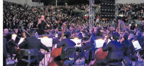
La Orquesta Sinfónica UdeC tendrá un concierto especial en el marco de la Escuela de Verano UdeC 2022.