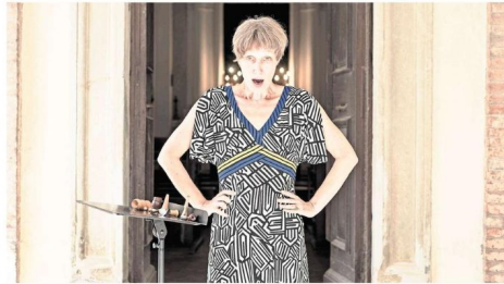
Ute Wassermann, una de las cantantes experimentales más importantes de Europa, actualmente, viene directamente a Concepción.

En ese sentido, y como complemento a palabras PM, busca dar espacio a las nuevas voces y manifestaciones de la poesía del sur de Chile que presentarán obras vivas sobre escenario y audiovisuales en forma de poesía en distintas locaciones de la